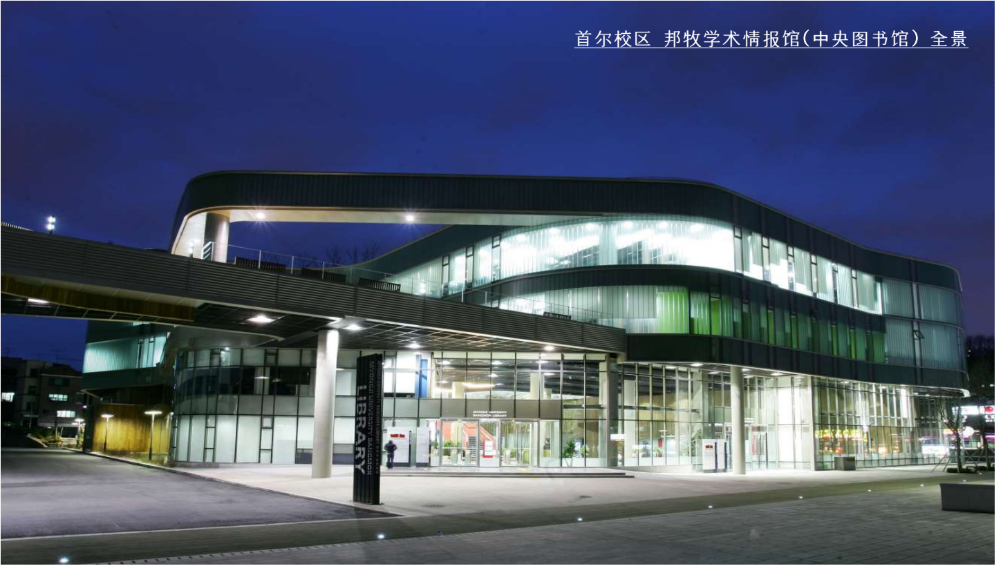
首尔校区 邦牧学术情报馆(中央图书馆)全景

明知大学建校于1948年，现有两个校区。分别位于韩国首都-首尔和教育都市-龙仁，是一所名门私立大学。自建校以来，培养了13万余名知识人。明知大学以多种多样的、实质性的国际化项目，让学生‘在明知感受世界，从明知走向世界’。一方面向所有学生提供通往世界道路上所需的丰富资源、优越环境；另一方面以最高水准的师资队伍、教学计划和尖端教育设施来确保培养世界所需人才。